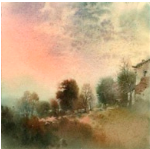
▲ Художник Олег Померанцев

С 5 по 24 февраля пройдет персональная выставка молодого петербургского художника, мастера городского пейзажа Павла Еськова, продолжающего традиции русского реалистического искусства. В его работах пейзажные сюжеты получают свежее, энергичное дыхание в живописных образах.