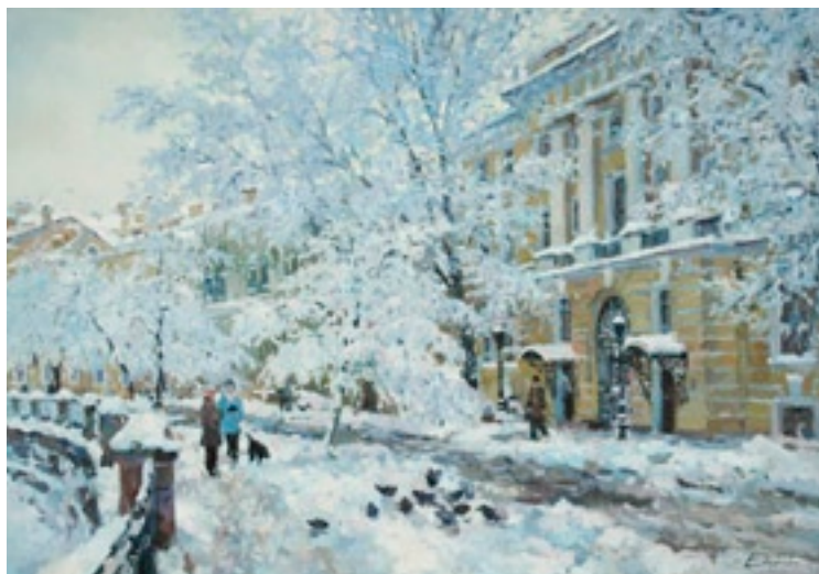
▲ Художник Павел Еськов